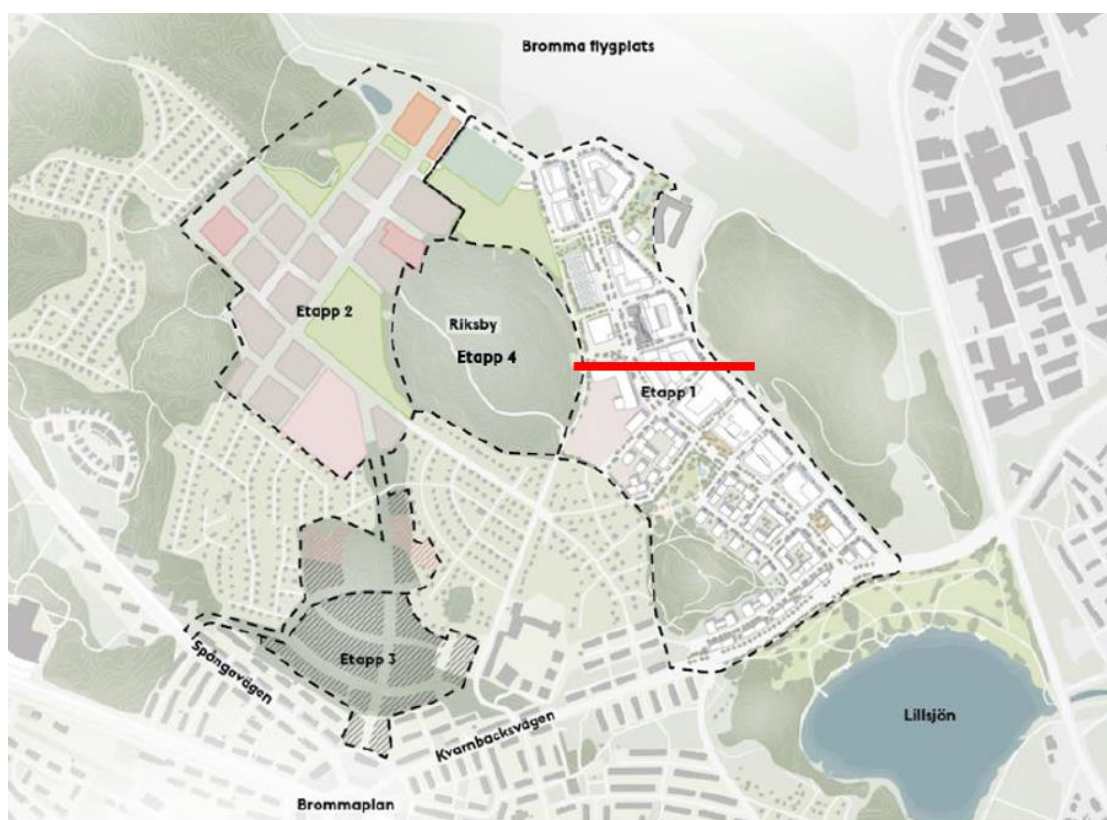
Figur 1, Översikt av etappindelning för Brommaprogrammet (Riksby). Röd linje representerar ungefärlig vattendelare.

Den 20 februari 2023 fattade Kommunfullmäktige övergripande reviderat inriktningsbeslut för Brommaprogrammet (Riksby). Detta syftar till att skapa cirka 4 000 nya bostäder under en 15-årsperiod i ett centralt och attraktivt läge med god tillgång till kollektivtrafik, rekreation och service. Programmet är uppdelat i fyra etapper enligt Figur 1 nedan. Investeringsutgiften för exploateringsprogrammet beräknades då till 5 087 mnkr, inklusive VA.